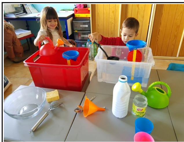
Apprentissage en classe de maternelle.

A noter, une journée porte ouverte sera bientôt organisée !