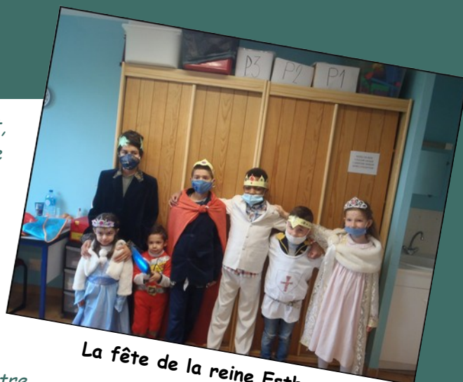
La fête de la reine Esther

« Revenant après plusieurs mois passé à l'étranger, nous avons atterri dans la région de Montauban. Bien avant notre arrivée, une connaissance nous avait parlé de cette école, et nous n'avons pas hésité très longtemps à y inscrire notre enfant, voyant cela comme une réponse à nos prières et à notre cheminement sur l'éducation scolaire. Il a été très bien accueilli, tant par ses nouveaux amis que par sa maîtresse et les différents intervenants. Le petit effectif lui permet encore aujourd'hui de s'habituer au système français, et de progresser dans son niveau scolaire. Nous remercions Dieu pour cette école, où il peut s'épanouir, grandir, et apprendre en toute quiétude. »